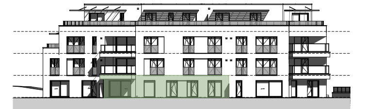
Façade / Gevel